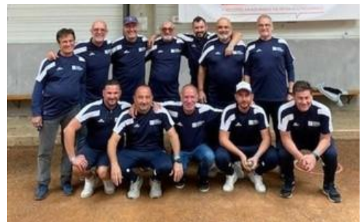
L'équipe Pétanque CECAZ