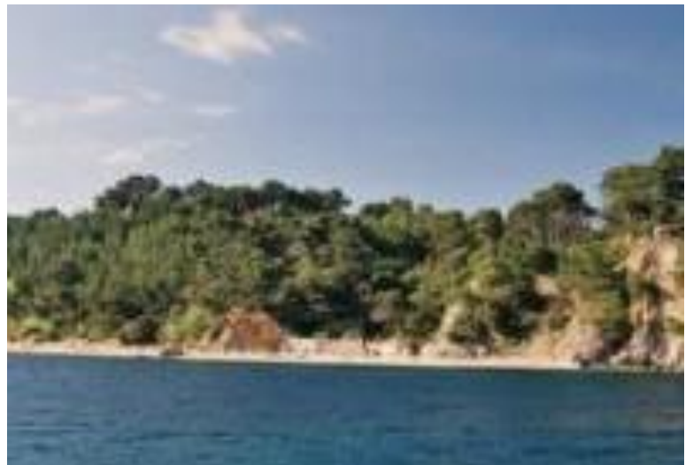
Plage du Monaco