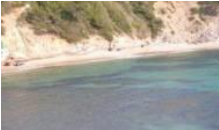
Plage des Bonettes

Un sentier autour de la mine vous permettra également de profiter d’un point de vue sur le littoral.